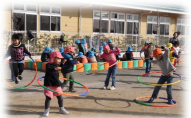
保育室の定員拡大