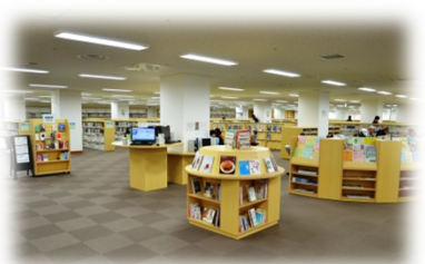
南部図書館を移設・拡張