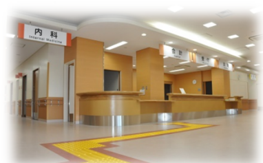
夜間急患診療所開設(成人・小児統合)