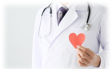
中学校修了まで子ども医療費の無料化