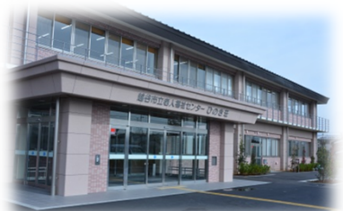
第4老人福祉センター「ひのき荘」開設