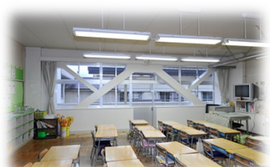
小・中学校生施設の耐震補強工事の前倒し実施