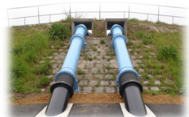
大成川排水機場整備