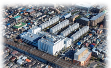
地域医療体制の整備促進(獨協医科大学越谷病院と連携)