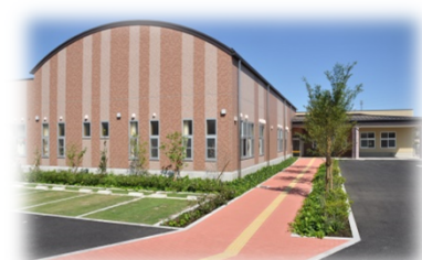
児童福祉センター開設