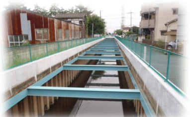
出羽堀の嵩上げ実施