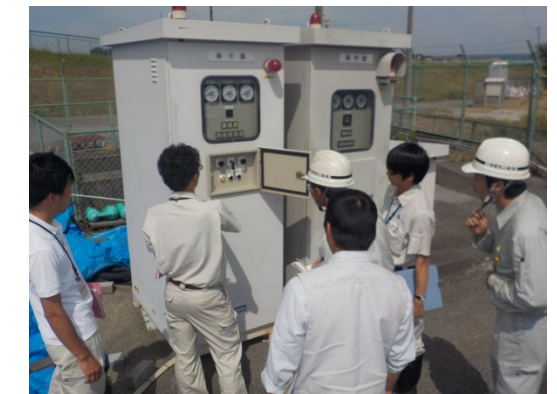
(排水ポンプの動作確認の様子)

【市長答弁】 ポンプの運転管理を依頼している越谷市建設業協会等が燃料およびごみの確認を徹底している。また、パトロール班に予備の燃料を携行させ、職員による補給が可能な体制を整えている。