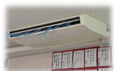
小・中学校普通教室等へのエアコン設置