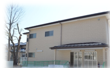
学童保育室の定員拡大