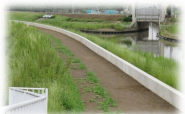
県との連携による新方川の嵩上げ実施