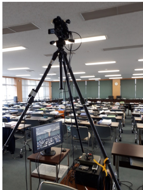
(録画中継用ビデオカメラ)