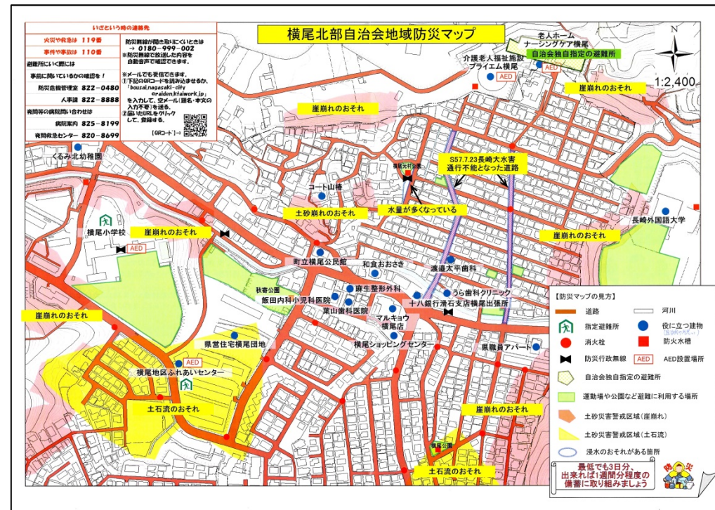
(長崎市で作成されている自主防災マップ)